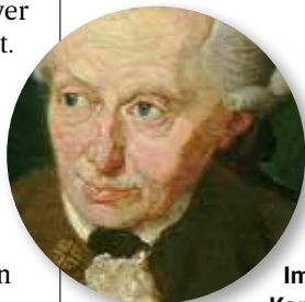
Immanuel Kants (1724–1804) moralske

► Tinder gikk nylig forbi både Spotify og Netflix i utbredelse.